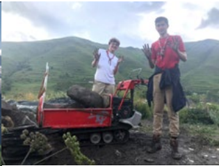
Le transport de pierres.