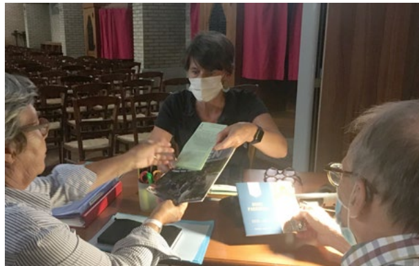
L'accueil à l'entrée de l'église.