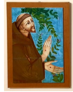
Clairsses Françaises d'Assise