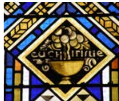
Vitrail de l'eucharistie à Saint-Léon.

Renseignements et inscription : assistantecure@saintleon.com