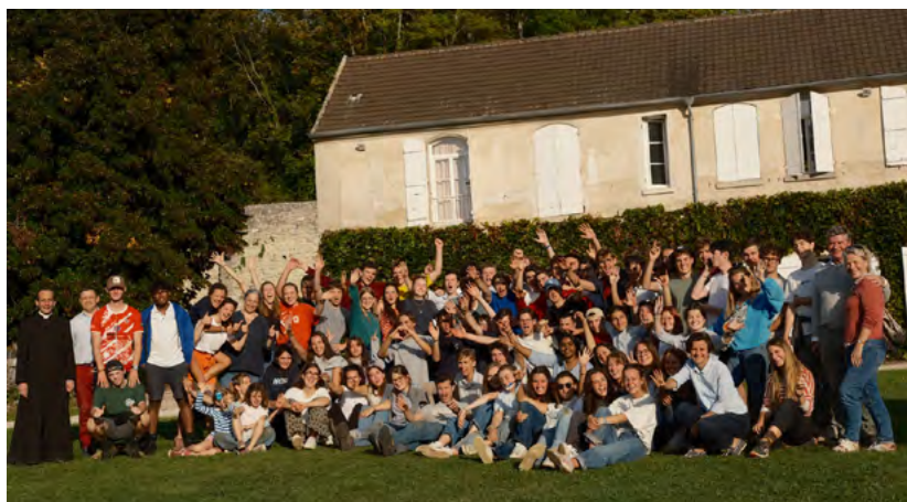
Week-end de fondation le 30 septembre 2023.

accueillir les amis et les visiteurs qui n'ont pas accès aux étages pour des raisons de sécurité et de protection de l'intimité de chacun.