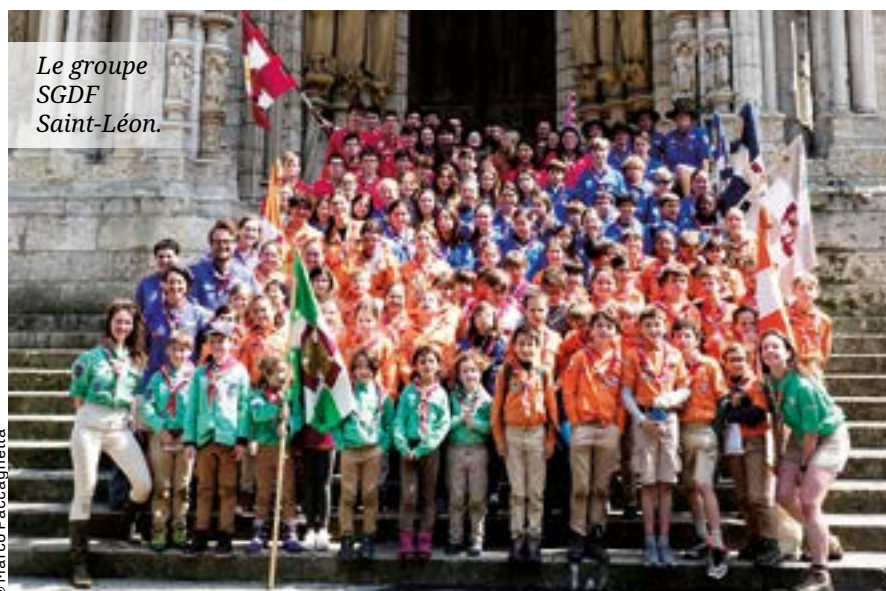
Le groupe SGDF Saint-Léon.